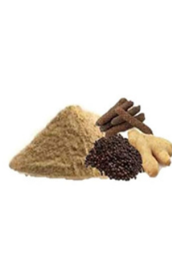
त्रिकुटा 75 MG