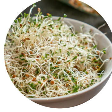
रिज़का 50 MG