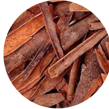
दालचीनी 25 MG