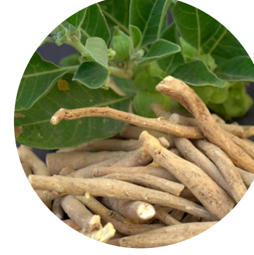
अश्वगंधा 100 MG