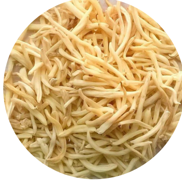
सफेद मूसली 70 MG