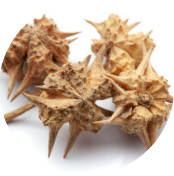
गोखरू 75 MG