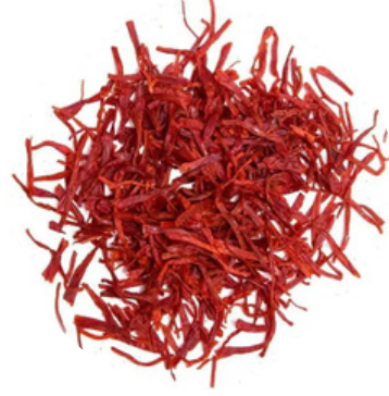
केसर 5 MG