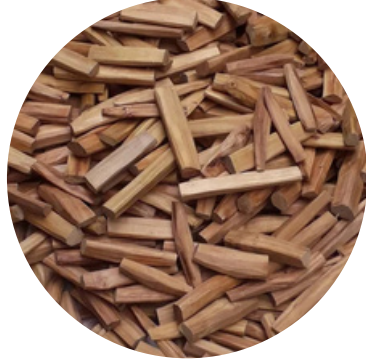
भूरा चंदन 25 MG