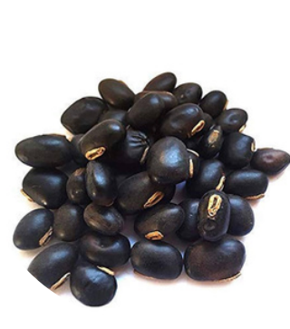
कौंच बीज 70 MG