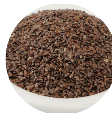
तालमखाना 30 MG