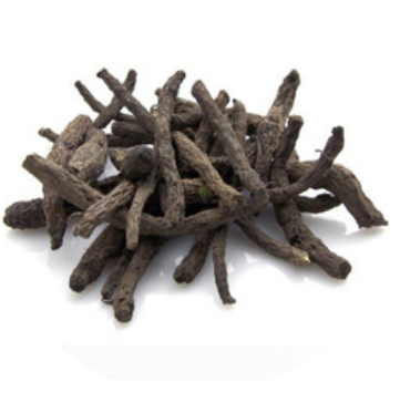
काली मूसली 50 MG