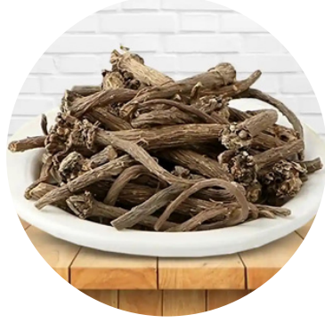
अकरकरा 100 MG