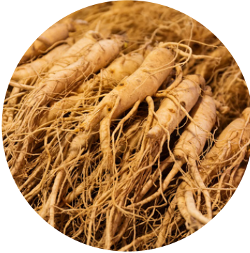
जिनसेंग 50 MG