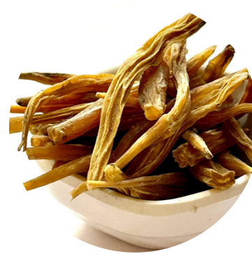
शतावरी 50 MG